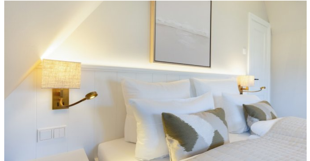
Beispielobjekt des Bauträgers 10