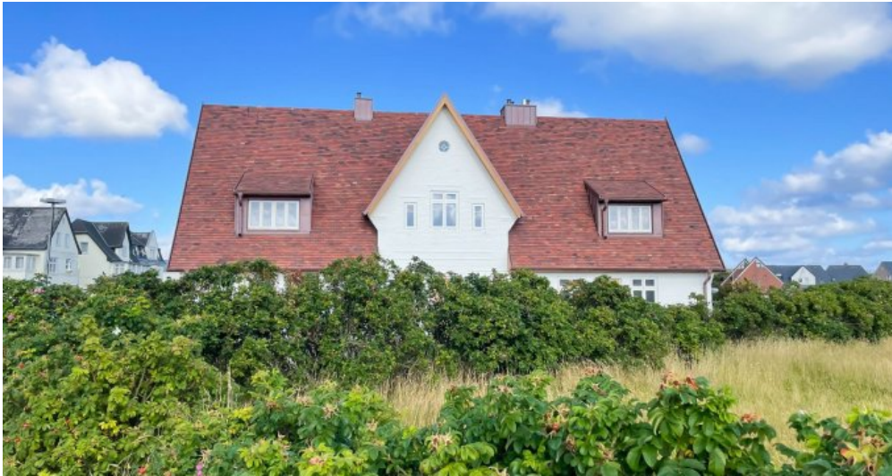
In Strand naher, ruhiger Lage