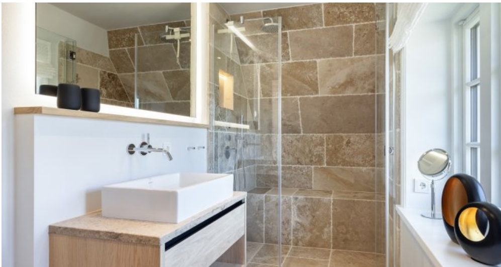
Beispielobjekt des Bauträgers 12