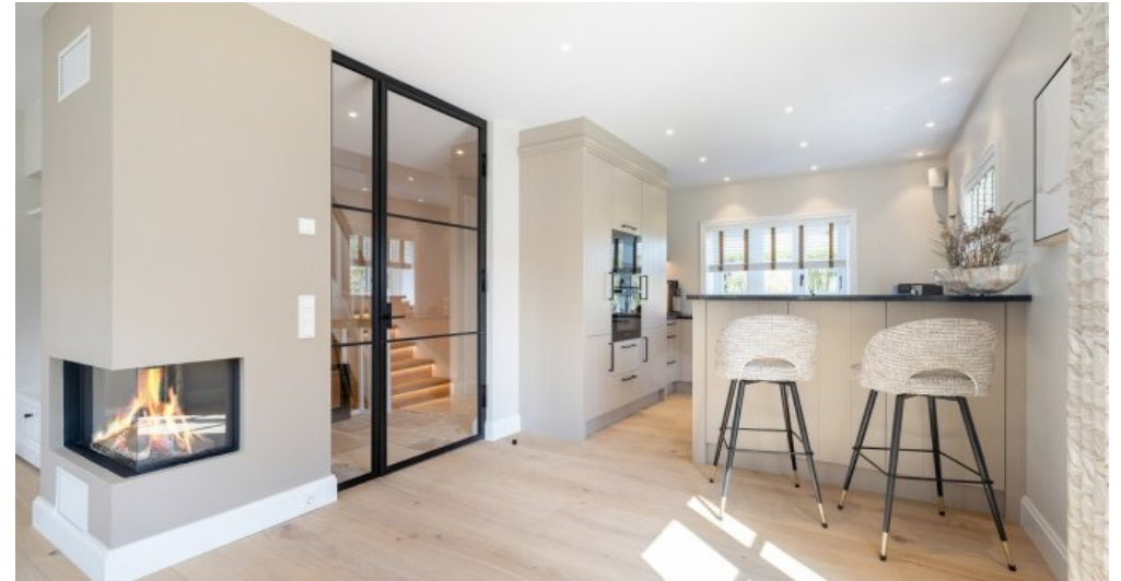
Beispielobjekt Küche, Kamin