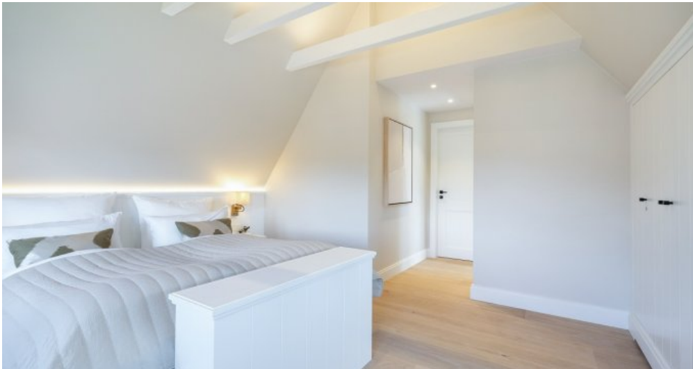
Beispielobjekt des Bauträgers 22