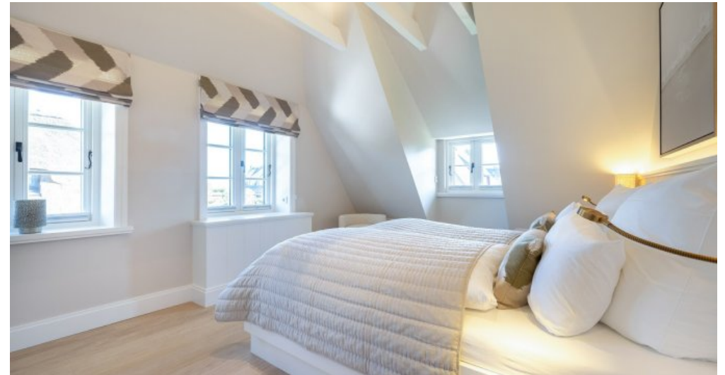
Beispielobjekt des Bauträgers 9