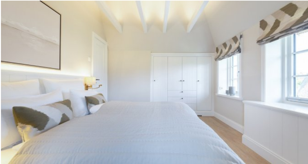
Beispielobjekt des Bauträgers 11