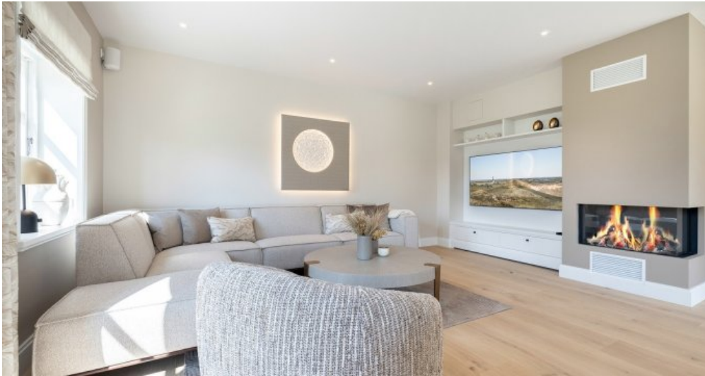
Beispielobjekt des Bauträgers 2