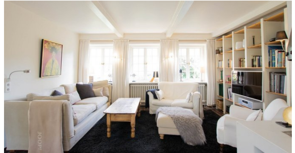
Gemütlicher Sitzecke WZ