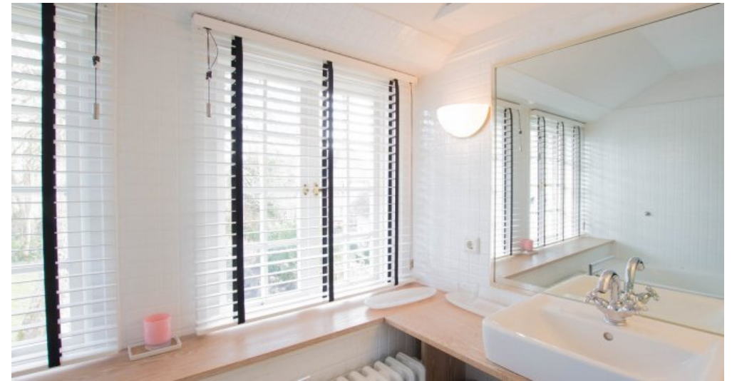
Bad Schlafen 1