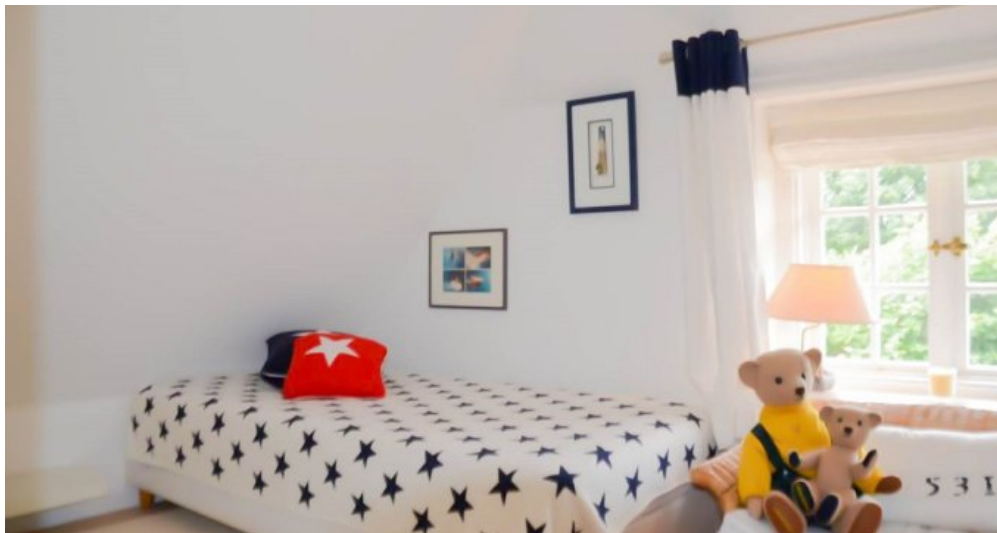
Schlafen 2 im OG mit Bad en Suite