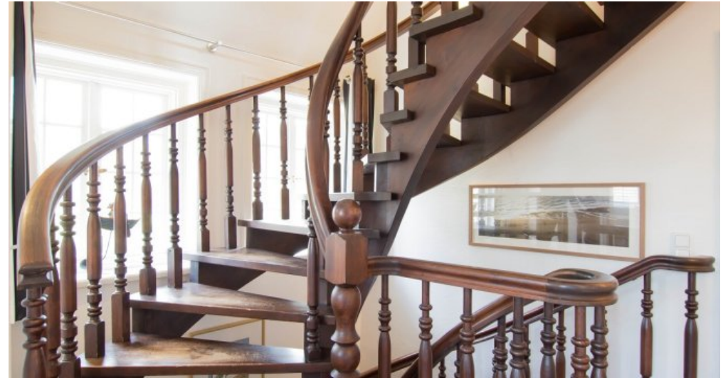
Schicke Treppe ins OG