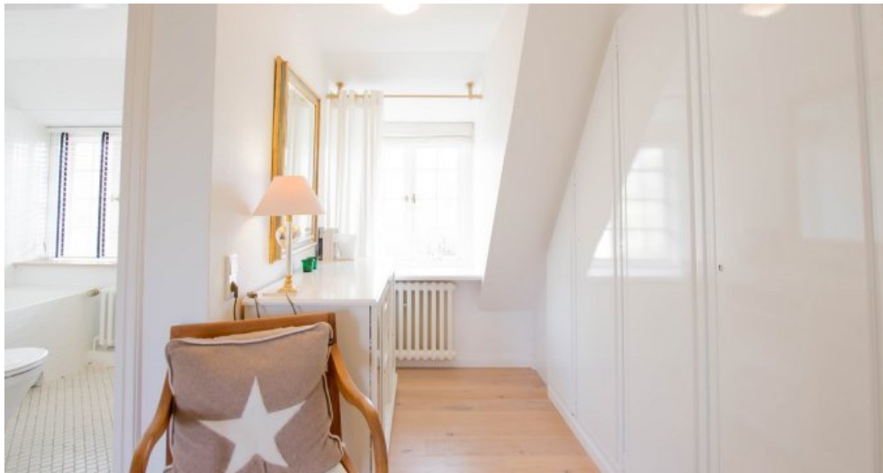
Schicke Tischlereinbauten Schlafen 2