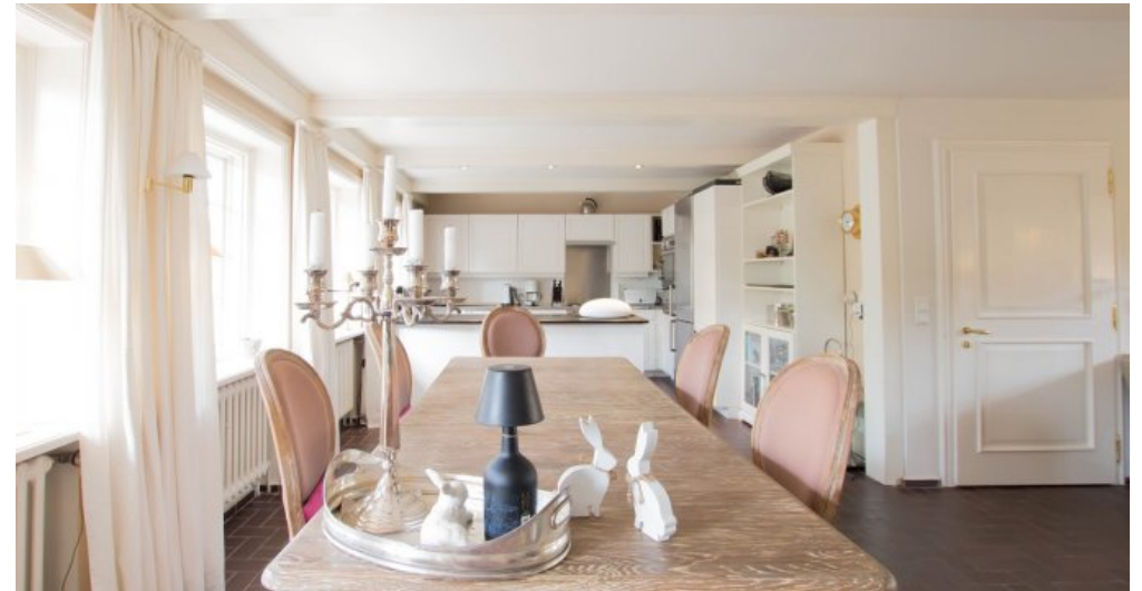
Essbereich mit offener Küche