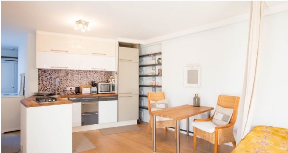
Offene Küche Fewo