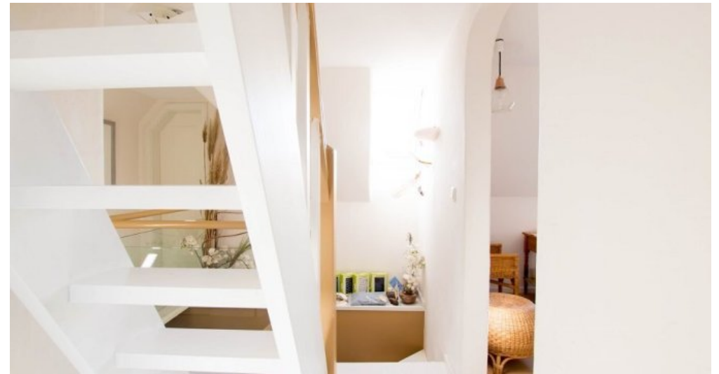
Treppe OG zum SPB