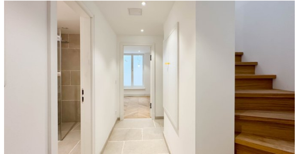
Flur im UG