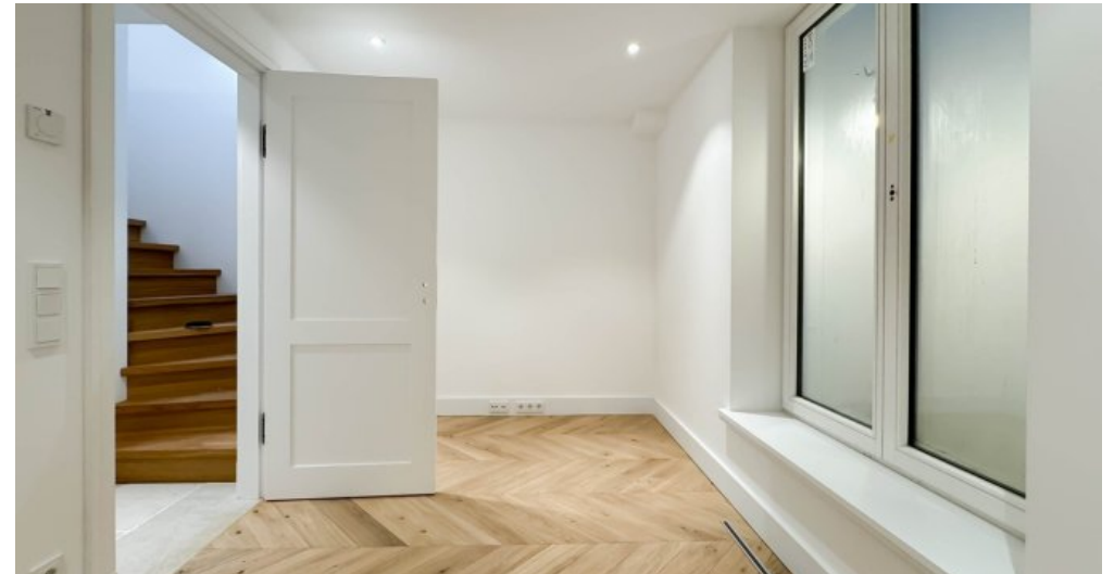
Raum 2 im UG mit großen Fenstern