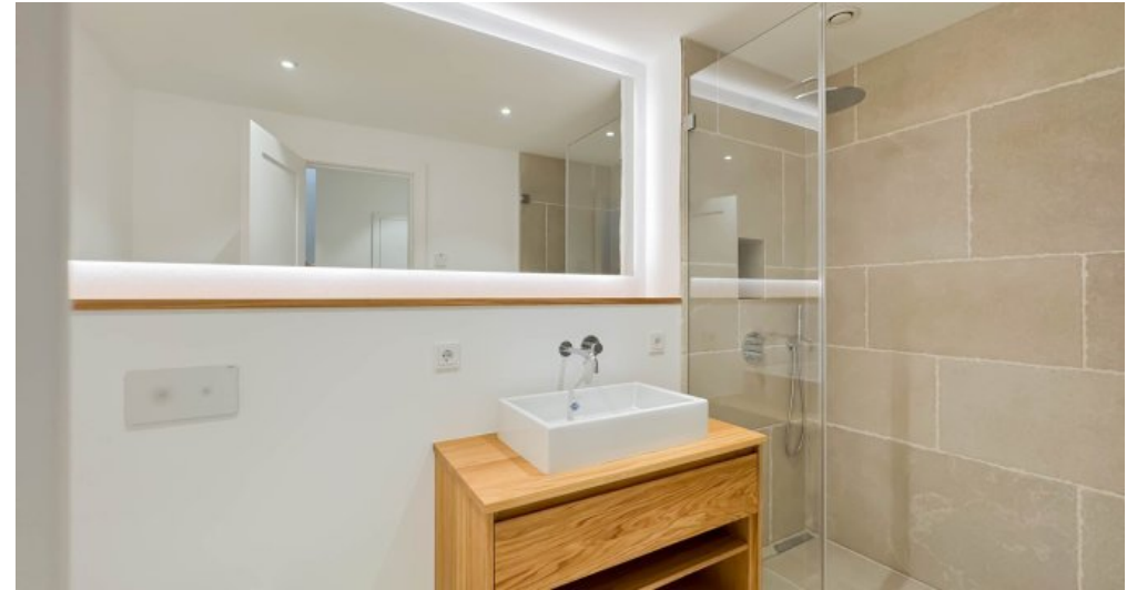
Großes Duschbad im UG