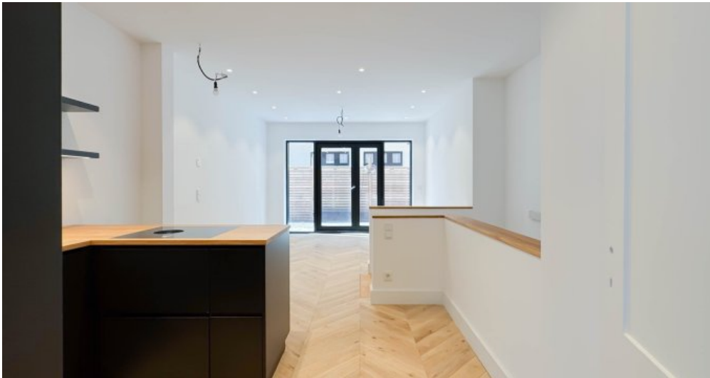
Zugang zum Wohn- Esszimmer