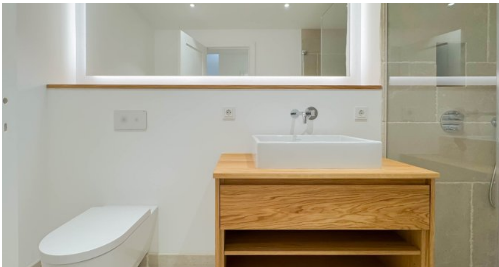
Exklusives Design mit Naturstein