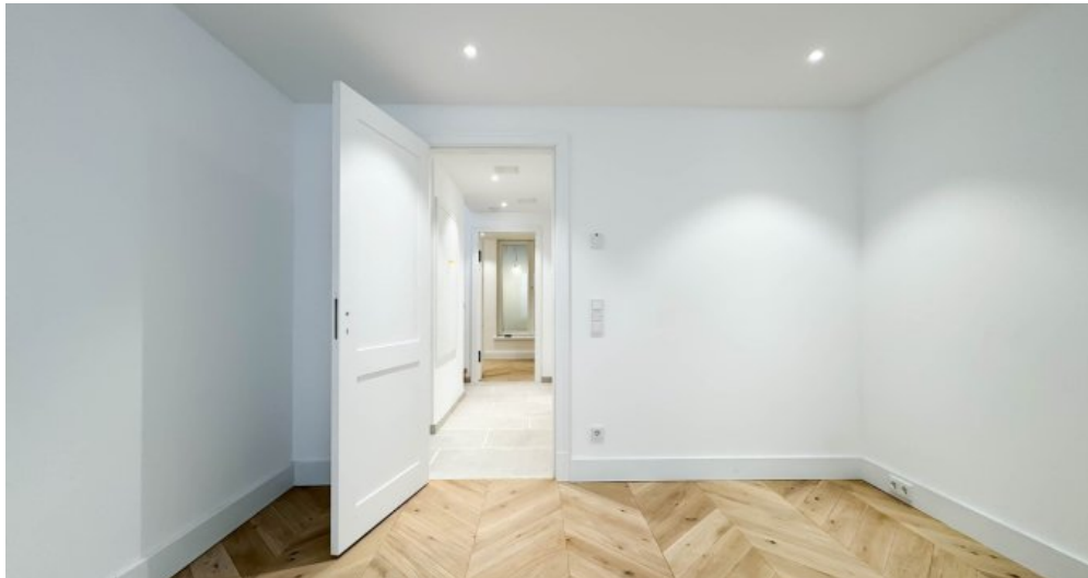
Raum 2 UG