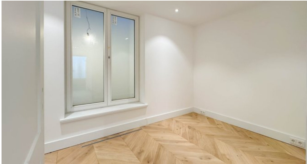
Raum 1 im UG mit großen Fenstern