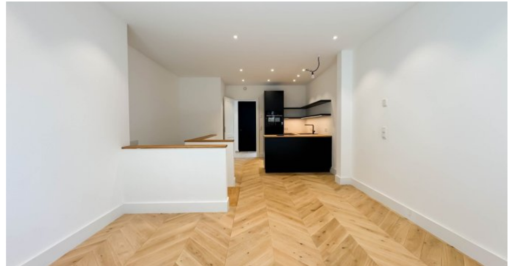
Wohn- Esszimmer mit Zugang zum UG