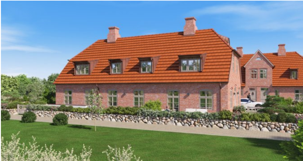
Visu MFH Südseite